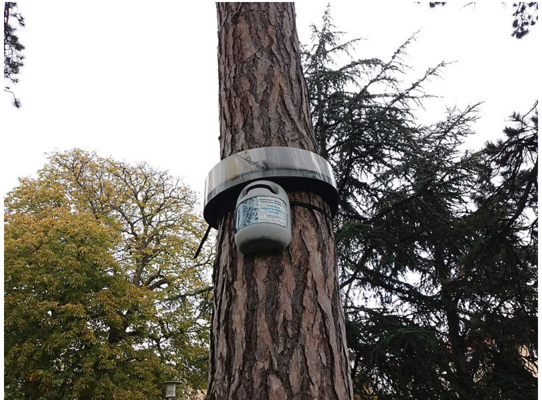
Exemple d'éco-piège à chenille processionnaire